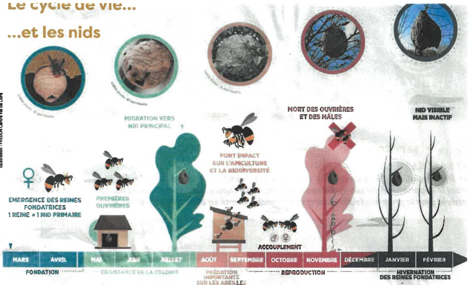
ILLUSTRATION : PHILIPPE LANTIERE VEA DE LOIRE

Il est inutile de détruire un nid à partir du mois de décembre à février !